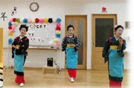
5月25日 麗秋流奈良教室様 あでやかで凛とした着物姿と優雅な舞にうっとり。ご利用者様と交流を図って頂きながら、たくさんの踊りを披露して頂きました。