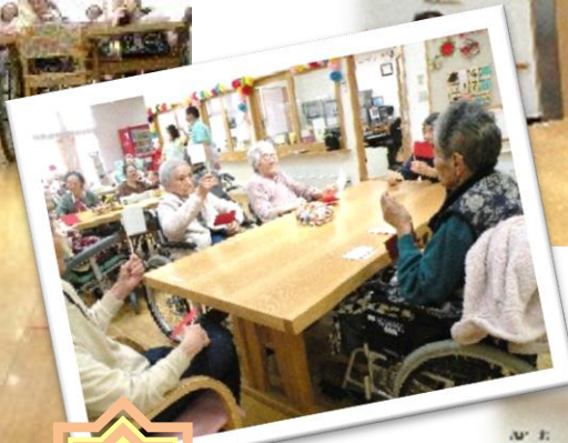
4月17日 旗上げゲーム

楽しい上に頭と体の運動になります。フェイントに引っかからない冷静さと、反応速度が求められてきますね。