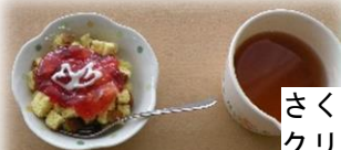
さくらの花びらを クリームで表現