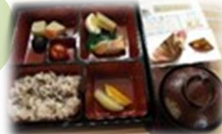
子供の日 お赤飯ご膳