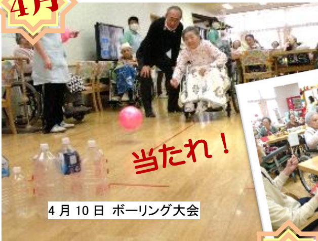
4月10日 ボーリング大会