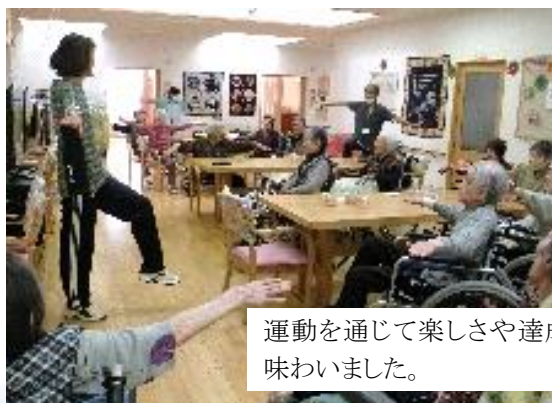
5月18日 運動指導士による軽体操